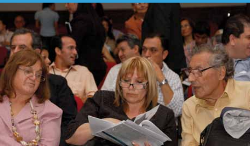
Más de trescientas personas se acercaron a la ceremonia de apertura del Encuentro.